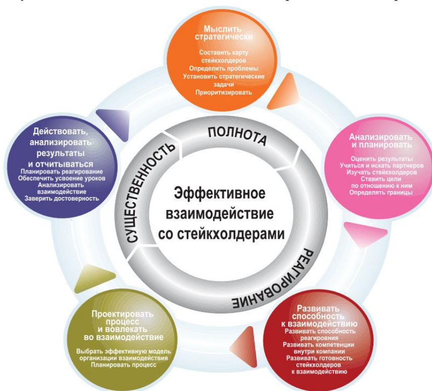
Рисунок 1. Развитие взаимодействия с заинтересованными сторонами